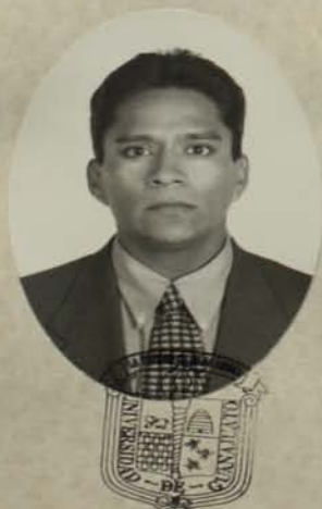
UNIVERSIDAD DE GUANAJUATO

Dado en la ciudad de Guanajuato, Gto., a los veinte días del mes de octubre del año de mil novecientos noventa y ocho.